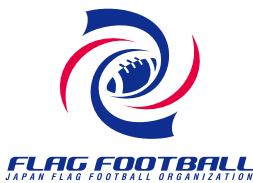
にほん 日本フラッグフットボール協会

新潟県出身。ソチ五輪2014においてスキーハーフパイプ競技女子代表として銅メダルを獲得。現在も後進の育成等様々な活動を行っている。