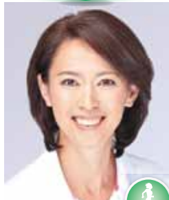
ありもり ゆうこ 有森 裕子 (マラソン)

岡山県出身。2大会連続オリンピックメダリスト、ハート・オブ・ゴールド代表理事、スペシャルオリンピック日本理事長等、幅広い分野で活躍。